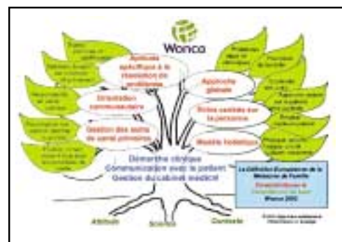
Figure 1: L'arbre de la WONCA